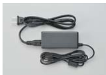
ACアダプタ(電源コード付き)